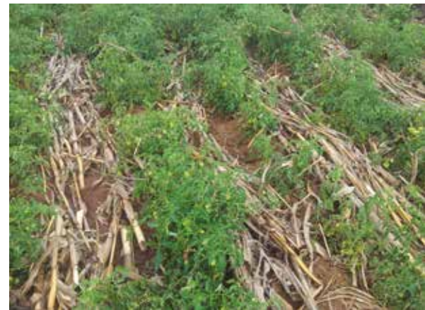
Einfache landwirtschaftliche Praktiken, wie das Mulchen, benötigen keine Investitionen und verbessern die Bodenqualität und Nahrungsmittelproduktion im Mount Elgon Projekt in Kenia.