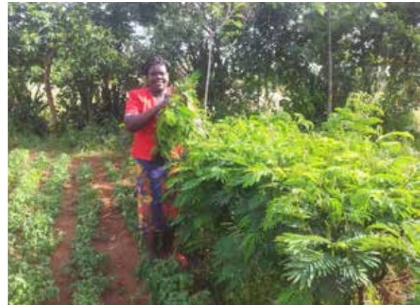
Umsetzung der SDGs ganz konkret: In der Fallstudie vom Livelihoods Fund in Kenia wurden Bäume zur Kohlenstoffspeicherung gepflanzt, deren Zweige gleichzeitig als Futter für Milchkühe geerntet werden.

Oft basiert die Messung der Fortschritte im Wald- und Landschaftswiederaufbau auf den freiwilligen Rückmeldungen der jeweiligen Länder und anderer Akteure, ohne eine fachliche Qualitätssicherung in Bezug auf den Schutz der Biodiversität und die Einbindung der lokalen Bevölkerung. So besteht die Gefahr, dass großflächige Monokulturplantagen als Waldwiederaufbau deklariert werden. Hier können Kriterien und Standards eine erste Hilfestellung bieten, um den Erhalt von Biodiversität und Ökosystemleistungen sowie die Einbindung der lokalen Bevölkerung beim Waldwiederaufbau sicherzustellen.