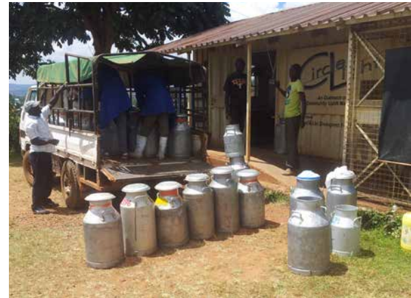
Die Förderung von Kooperativen ermöglicht die Teilhabe von benachteiligten Gruppen sowie die Stärkung der Verhandlungsmacht von Kleinbauern im Mount Elgon Projekt in Kenia.