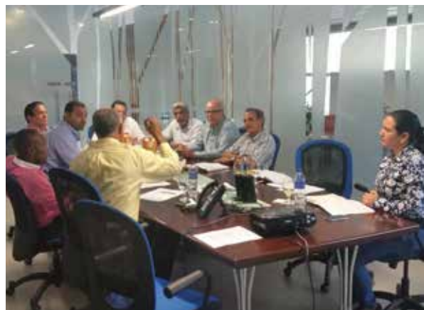
Treffen aller Akteure auf allen Ebenen um Waldwiederaufbau gemeinsam voranzutreiben

Damit Initiativen zum Wiederaufbau von Wäldern und Landschaften auf der internationalen Ebene keine Gefahr laufen, unglaubwürdig oder bedeutungslos zu werden, ist es wichtig, Minimalanforderungen oder Ausschlusskriterien für die Auswahl an erfolgsversprechenden FLR-Maßnahmen zu entwickeln und international anzuerkennen. Zu diesen Anforderungen und Kriterien könnten insbesondere die Rechte von lokalen Gemeinschaften und indigenen Völkern, Konsultations- und Beteiligungsprozesse sowie Umweltbelange, insbesondere in Bezug auf Naturwälder und die biologische Vielfalt zählen, wie es in anderen internationalen Safeguards schon gibt.