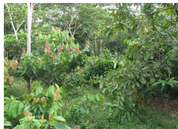
Agroforstsysteme schaffen neue Einkommensquellen und senken den Druck auf den Regenwald, z. B. in der Region Madre de Dios in Peru.