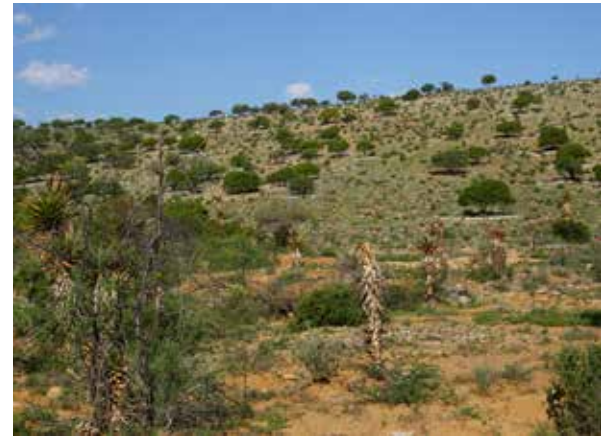
Stark degradierte Flächen benötigen innovative Finanzierungsideen und Investoren mit längeren Investitionszeiträumen von mindestens zehn Jahren, wie im Baviaanskloof in Südafrika.

Investoren, wie institutionelle Anleger oder Investment Fonds mit großen Anlagevermögen, investieren ihr Kapital vorzugsweise in wenige und dafür größere Projekte, um Verwaltungsaufwand und Kosten gering zu halten. Dies stellt Projektentwickler vor große Herausforderungen, insbesondere, wenn Kleinbauern eingebunden werden und mit artenreichen Systemen in der Landschaft gearbeitet wird. So ist die Erwirtschaftung einer hohen Rendite für langfristig angelegte Projekte mit kleinbäuerlichen Strukturen und artenreichen Systemen schwierig. Gründe dafür sind der hohe Koordinationsaufwand, der erforderliche Kapazitätsaufbau und die notwendigen differenzierten Kenntnisse zu nachhaltigen Anbaumethoden. Häufig verfügen die Kleinbauernfamilien selbst über ein Einkommen, welches unterhalb des existenzsichernden Minimums liegt. Mit Projekten zum Aufbau von Wald- und Agroforstsystemen verbessert sich ihre Situation häufig. Allerdings werden selten hohe Einkommen generiert, welche attraktive Renditen für die Investoren abwerfen können.