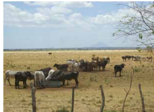
Die Umwandlung von Regenwäldern in Weideflächen führt zu Zerstörung des Ökosystems und der Degradierung der Böden.