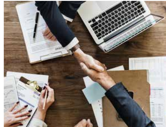
Eine Zusammenarbeit zwischen Akteuren aus Politik, Privatsektor, Finanzwirtschaft, Wissenschaft und Zivilgesellschaft ist für die Erreichung internationaler Abkommen entscheidend.

In dieser Studie haben OroVerde – Die Tropenwaldstiftung und der Global Nature Fund verschiedene Initiativen zum Wiederaufbau von Wäldern und Landschaften mit privater Finanzierung analysiert und wichtige Faktoren identifiziert, die zum Erfolg der einzelnen Maßnahmen beitragen.