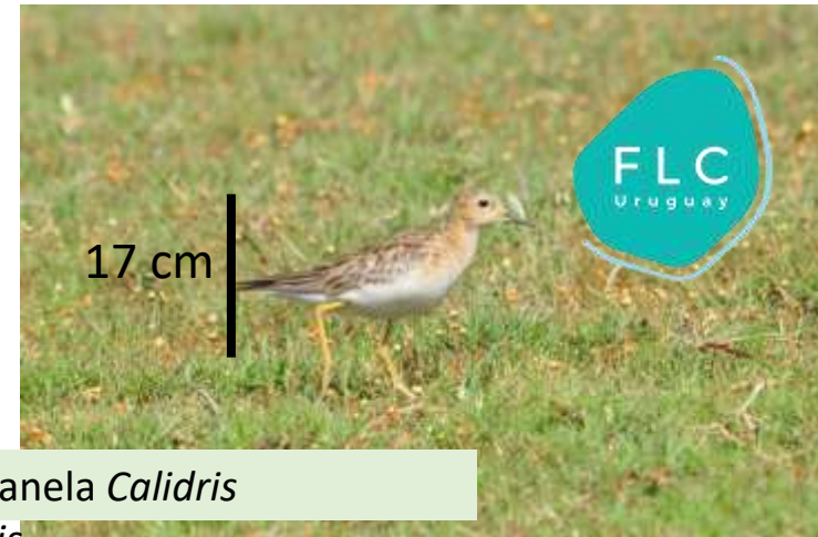
Playerito canela Calidris subruficollis