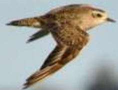
Chorlo pampa Pluvialis dominica