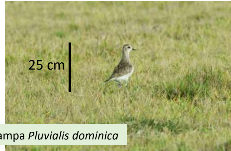
Chorlo pampa Pluvialis dominica